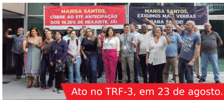
Ato no TRF-3, em 23 de agosto.

O Sintrajud participa e reforça a convocação da Jornada de Mobilização convocada pelo Fonasefe (Fórum das Entidades Nacionais de Servidores Federais) e a Fenajufe, a federação da categoria. Ao longo desta semana, colegas de todo o país estarão em Brasília para pressionar parlamentares e o governo Lula/Alckmin em defesa de demandas do funcionalismo.