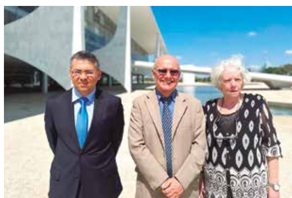
Iniciativas em Brasília e SP defendem derrubada dos vetos 10 e 25 Pág. 3