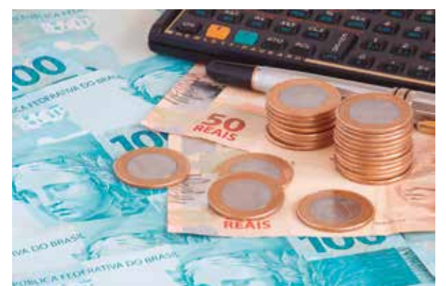
Estudos orçamentários comprovam possibilidade de atendimento a demandas Pág. 4