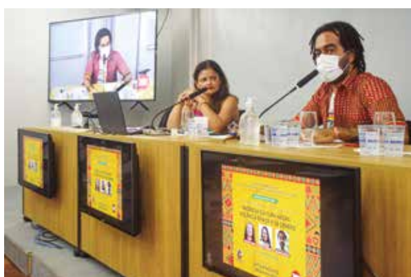
Atividade celebra consciência negra no próximo dia 11 de novembro Pág. 2