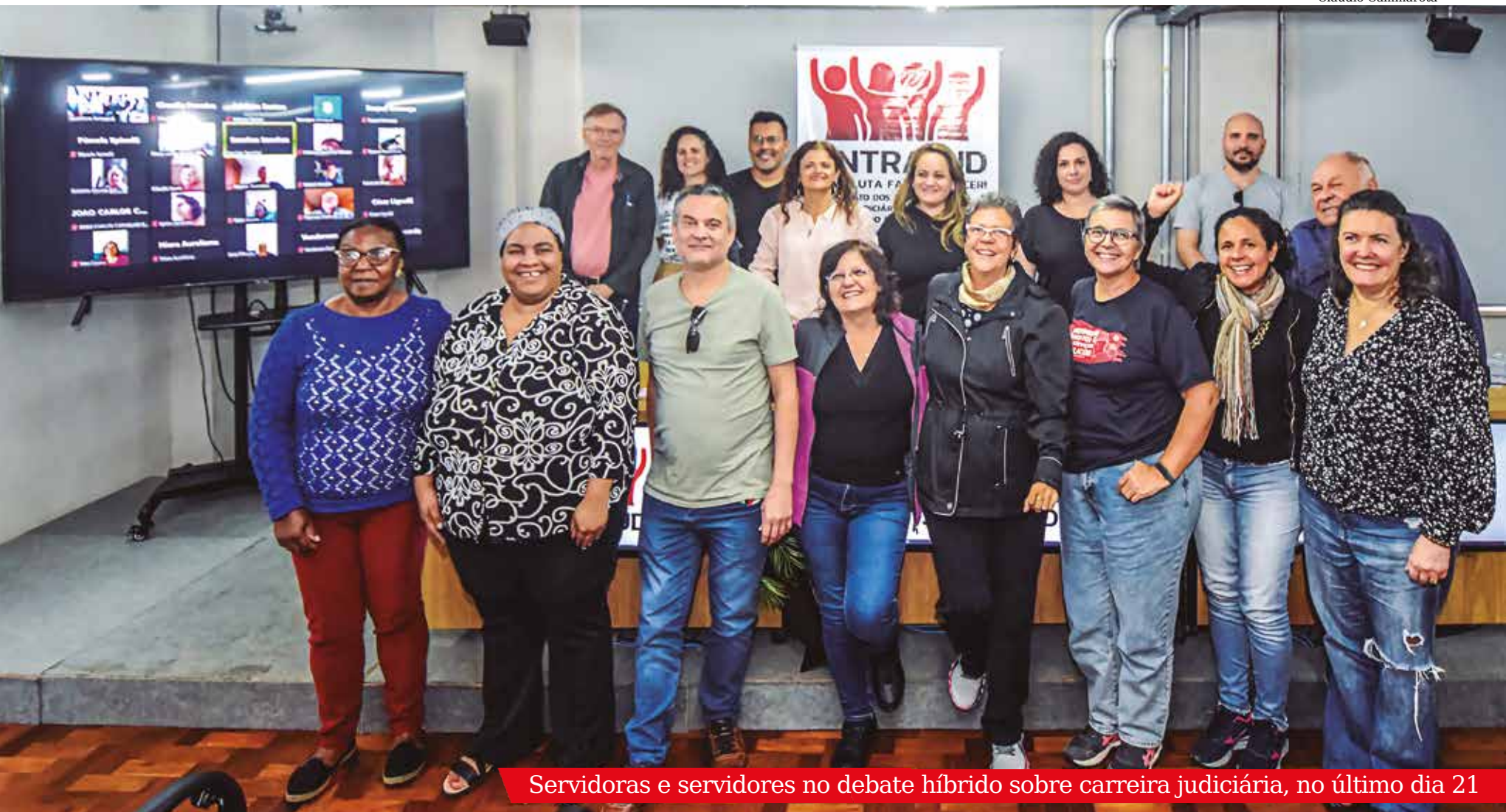
Servidoras e servidores no debate híbrido sobre carreira judiciária, no último dia 21