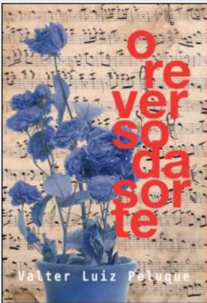
Capa do livro.