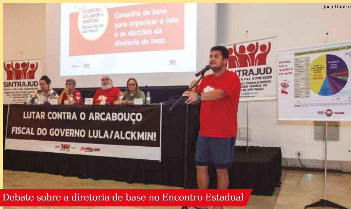
Debate sobre a diretoria de base no Encontro Estadual

Formulários de inscrição de candidaturas para diretoria de base ou representação de aposentados/as estão disponíveis no site do Sindicato ou no QR Code na página 6.