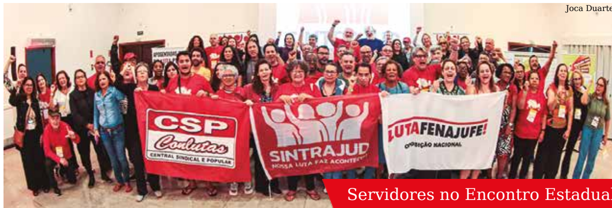
Servidores no Encontro Estadual