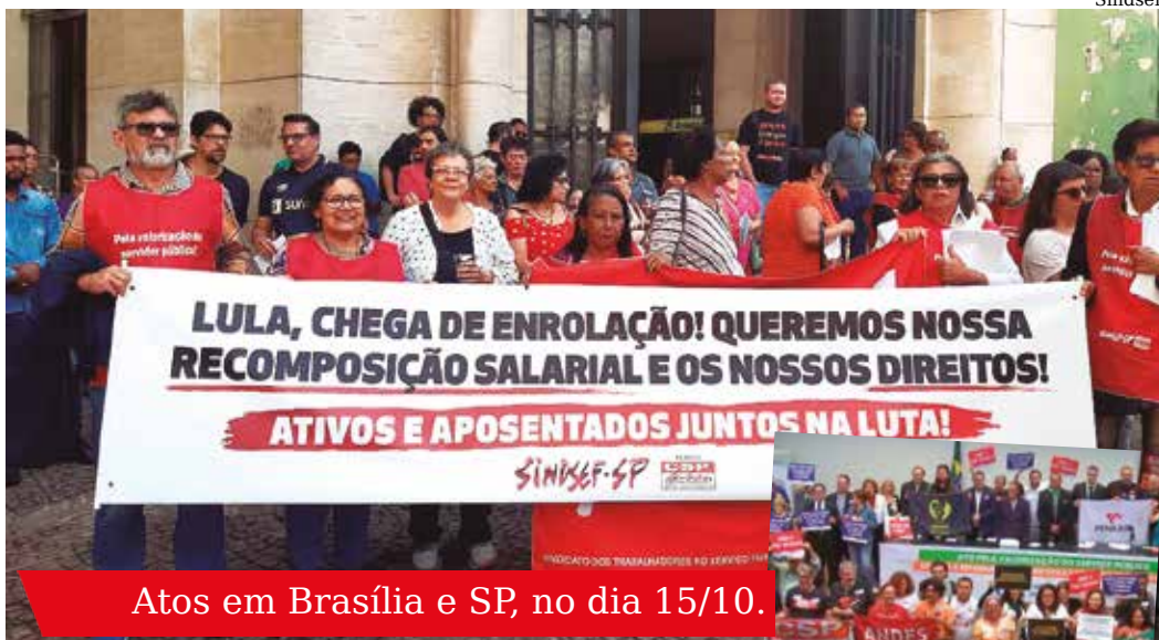
Atos em Brasília e SP, no dia 15/10.