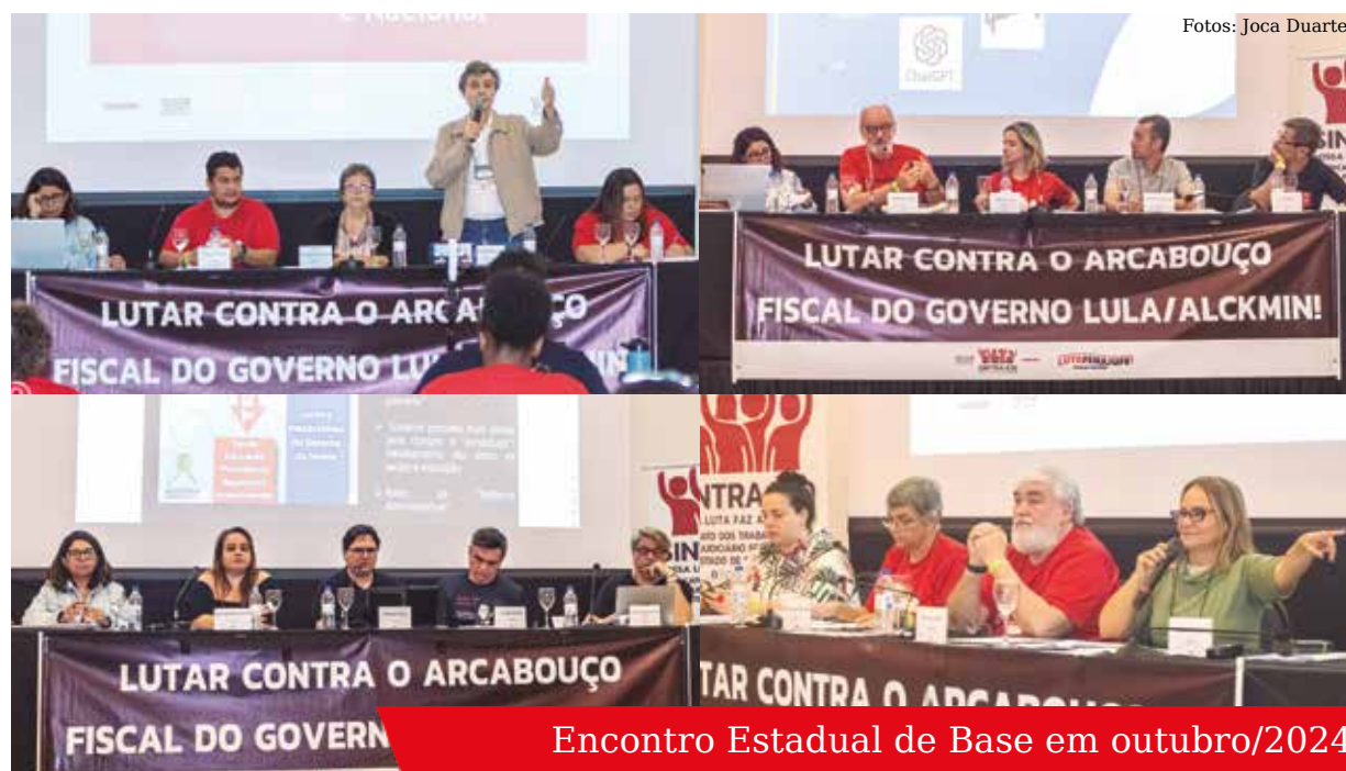
Encontro Estadual de Base em outubro/2024

Eleições acontecem em novembro, com apresentação de eleitos/as na festa de fim de ano do Sintrajud, que em 2024 acontecerá no dia 29 de novembro.