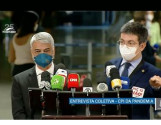
Senado (CPI da Covid)