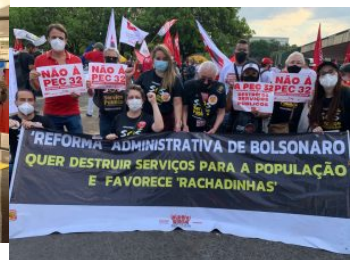
Esplanada dos Ministérios