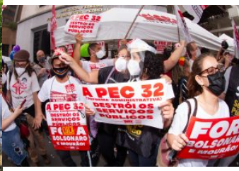
Ato na Avenida Paulista