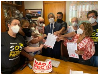
Servidores de SP com o deputado Vicentinho (PT-SP), segurando a carta do Sintrajud.