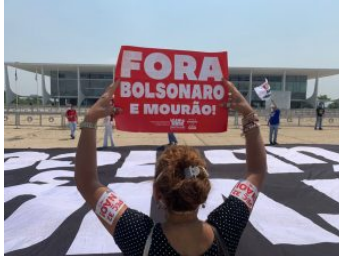
Palácio do Planalto

Comando de mobilização contra a PEC 32 se reúne nesta sexta, 8 | 3