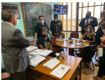
Com o deputado Átila Lins (PP-AM).