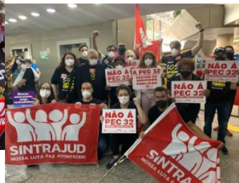
Aeroporto Juscelino Kubitschek