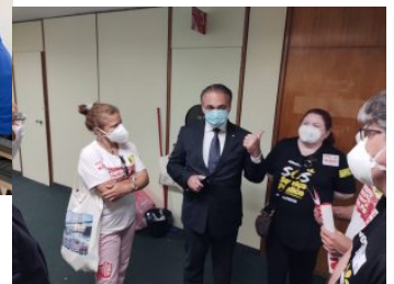
Com o deputado Roberto Lucena (Podemos-SP).