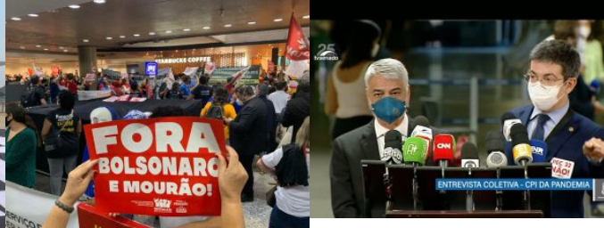
Aeroporto Juscelino Kubitschek