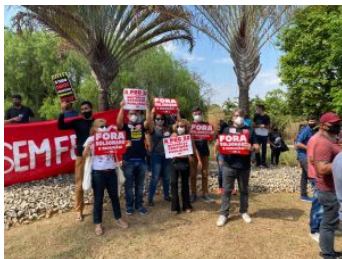
Mansão de Flávio Bolsonaro

Nesta quinta, estão sendo visitados vários gabinetes novamente e alguns deputados receberam os representantes do Sindicato com muita simpatia à análise da categoria sobre a PEC 32, como Alencar Santana Braga (PT-SP), Cléber Verde (Republicanos-MA), Fernanda Melchionna (PSOL-RS) e Jandira Feghali (PCdoB-RJ).