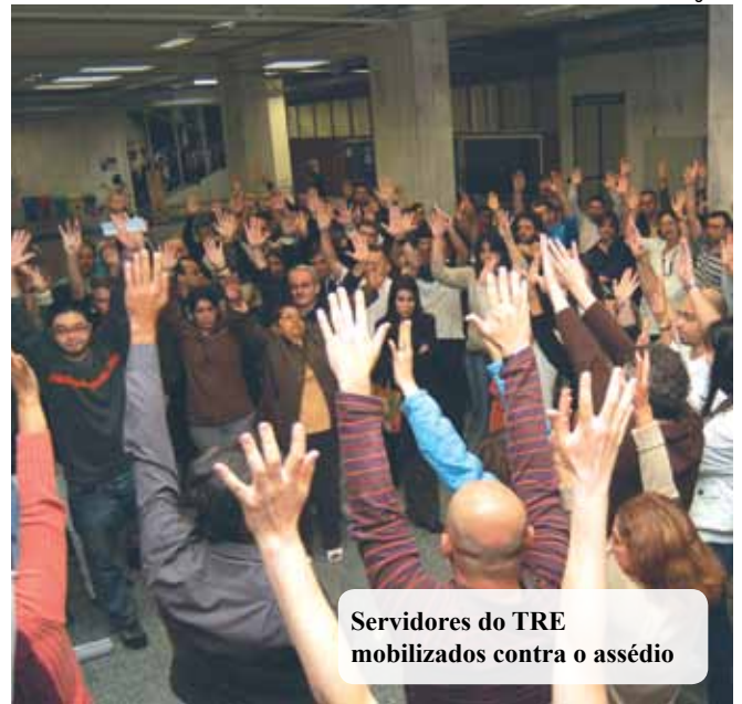
Servidores do TRE mobilizados contra o assédio

O Sindicato orienta os servidores que sofrerem assédio que busquem formas de comprovar o que ocorreu. Falem aos colegas, procurem fazer algum registro e, principalmente, procurem o Sindicato.